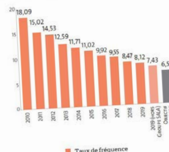
Évolution du taux de fréquence des accidents du travail depuis 2010